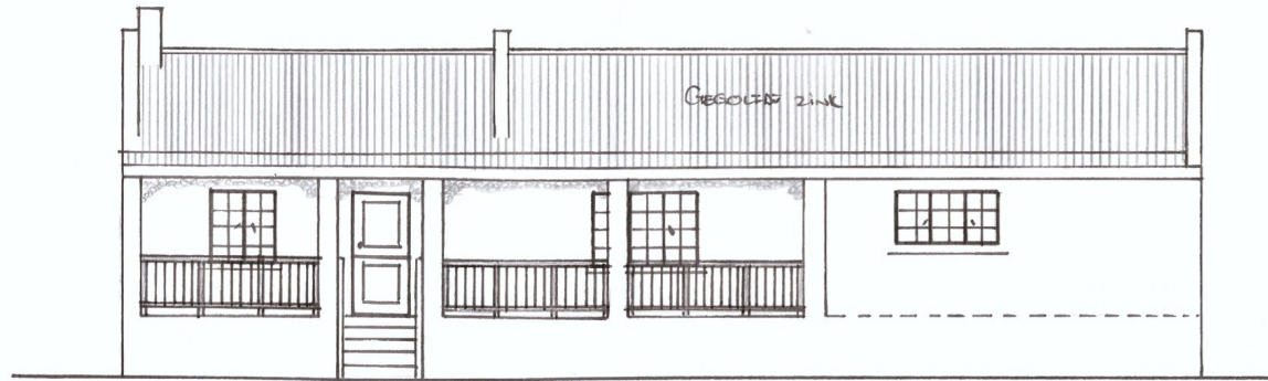
NOORD / MILNERSTRAAT AANSIG SKAAL 1:100