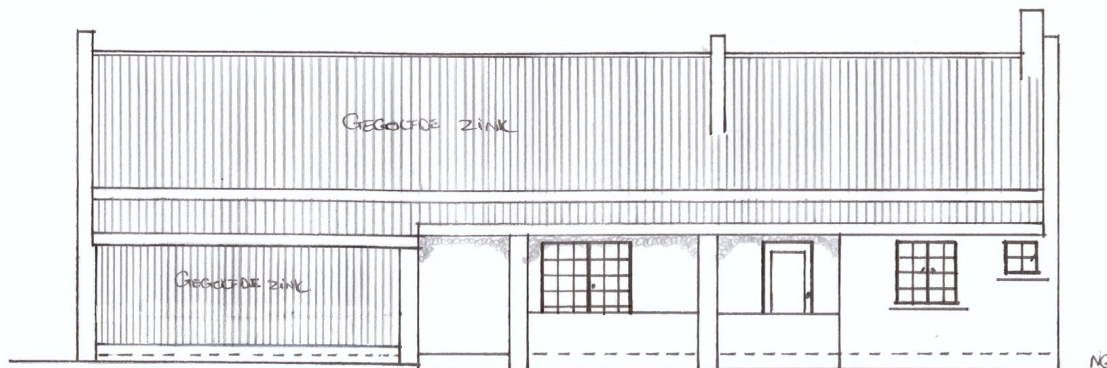
SUID AANSIG SKAAL 1:100